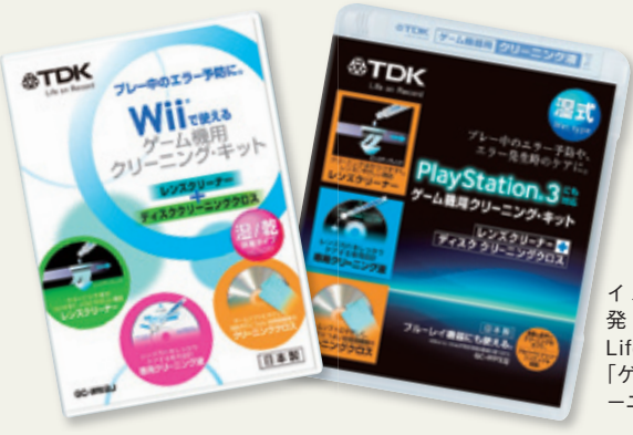
イメージが 発売する TDK Life on Record 「ゲーム機用ク リーニング・キット」

代表的な家庭用ゲーム機であるWiiは今年2月に国内販売台数1000万台を突破。一方のPlayStation3も今年4月に500万台を突破した。全国5000万世帯の家庭の約3割に、テレビの横にはどちらか1台が普及している計算になる。ディスクは非常にデリケートで、指紋などの汚れには敏感。小さなお子様のいるお客様には見逃せないアイテムだ。