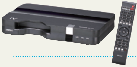
ターゲットとなるお客様のニーズを考えれば、単体機でなく、320GBのカセットハードディスクiVを同梱したモデルがお薦めしやすい

お客様に対しては、“録画機能が付いた地デジチューナー”という説明がわかりやすいだろう。320GBのiVカセットを同梱したタイプも用意され、実勢価格は3万5000円前後になる。地デジ化を叶えるためのお客様の選択肢の幅を広げるひとつのアイテムとして、地デジチューナーコーナー、レコーダーコーナーへの品揃えを強化していきたい。