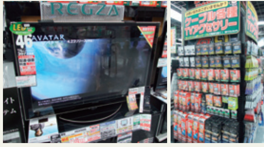
ヨドバシカメラマルチメディアAkibaでは液晶ガードを實際にテレビに装着。取りつけた時の画質や取り付け方も確認できる